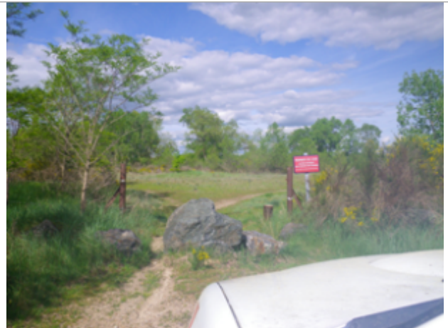
Vue du site BDHE 6084 point de repère 6216

Coordonnées WGS84 : X: 3.69520796 / Y: 46.65610848