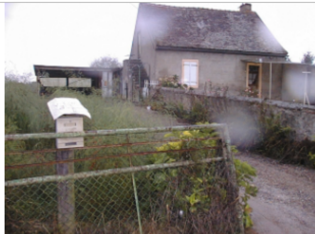
Vue du site BDHE 6060 point de repère 6199

Coordonnées WGS84 : X: 3.87062983 / Y: 46.48695990