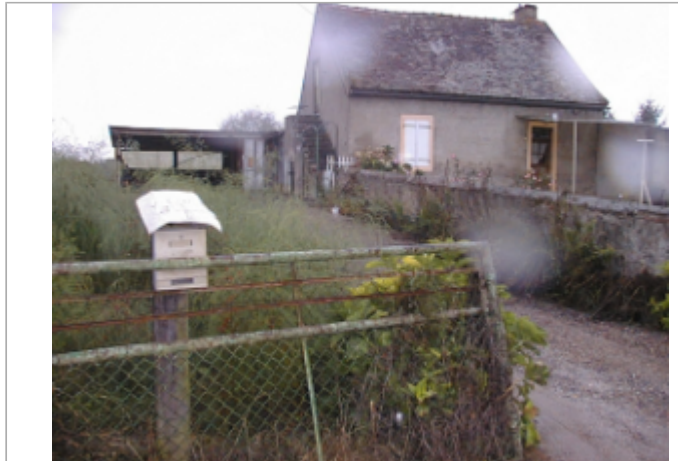
Vue du site BDHE 6060 point de repère 6199