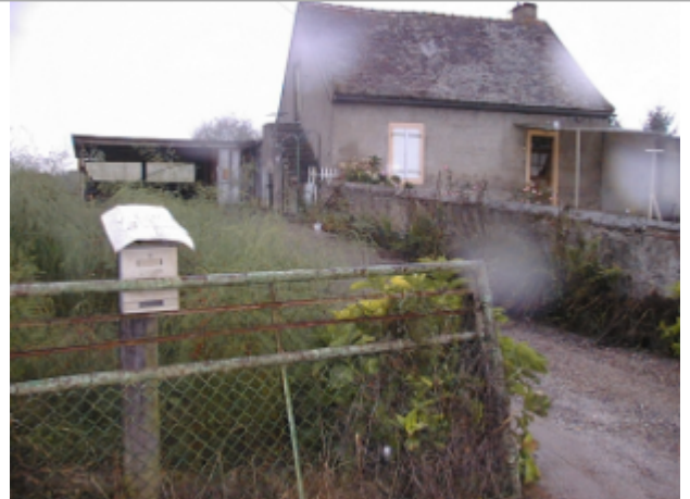
Vue du site BDHE 6060 point de repère 6199

Coordonnées WGS84 : X: 3.87062983 / Y: 46.48695990