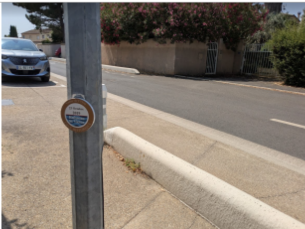
chemin st michel

Altitude calculée de l'eau (en m) : 6.991