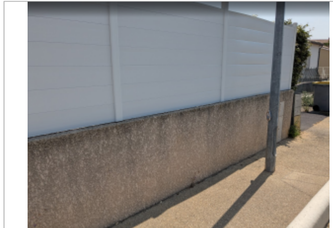
chemin st michel

Coordonnées WGS84 : X: 3.27495844 / Y: 43.32053990