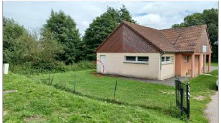
Vue depuis la rue du Stade.

Coordonnées WGS84 : X: 1.26300130 / Y: 49.81564900