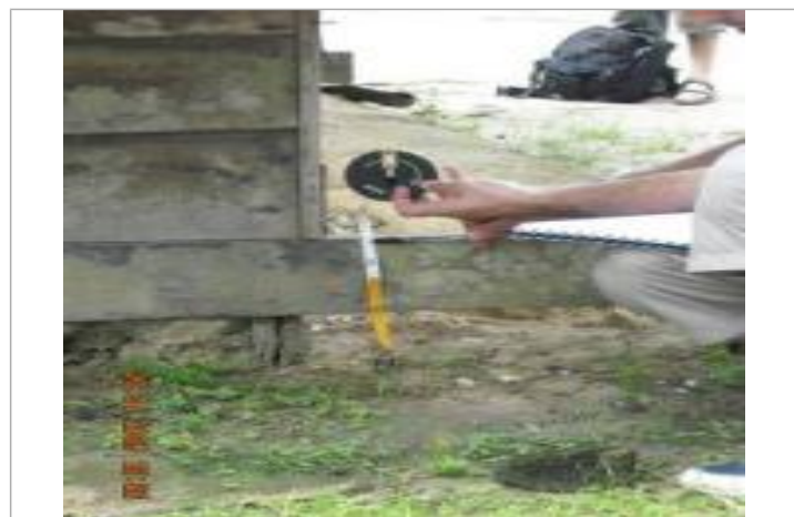
Photographie du repère