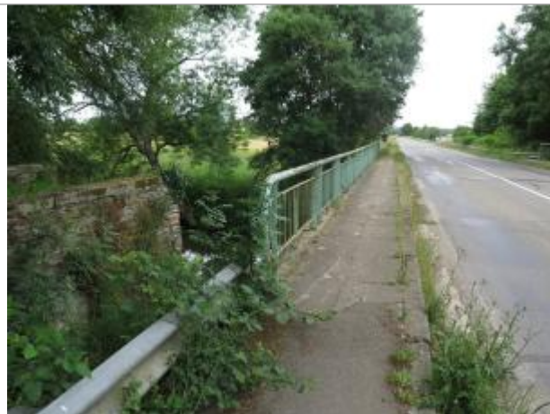
Vue de la route D77 , dos à Bruz

Coordonnées WGS84 : X: -1.74560790 / Y: 48.01463300