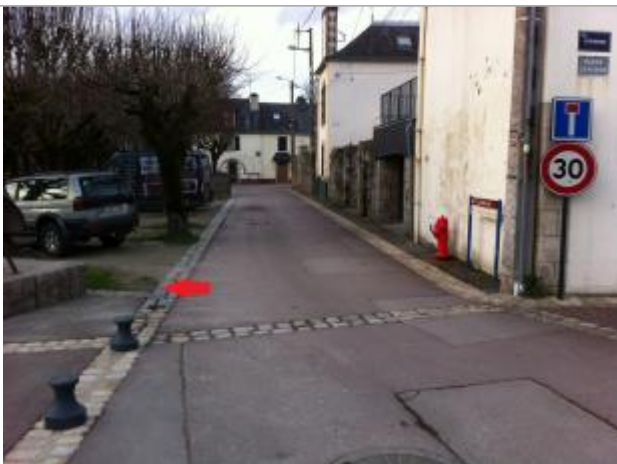
Limite au sol à proximité de la statue

Altitude calculée de l'eau (en m) : 5.06 m