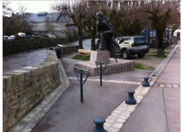
Vue d'ensemble banc publique de la place Lovignon

Coordonnées WGS84 : X: -3.54335060 / Y: 47.87289300