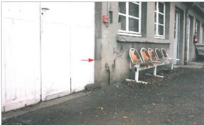
Locaux ferroviaires - Cours Montalivet