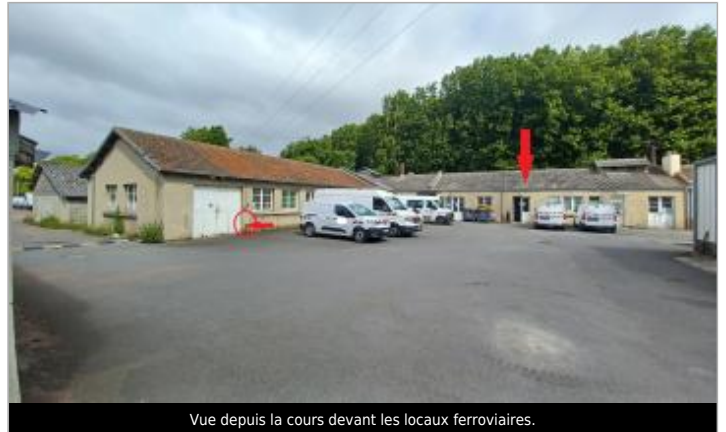
Vue depuis la cours devant les locaux ferroviaires.

Coordonnées WGS84 : X: -0.34064300 / Y: 49.17894500