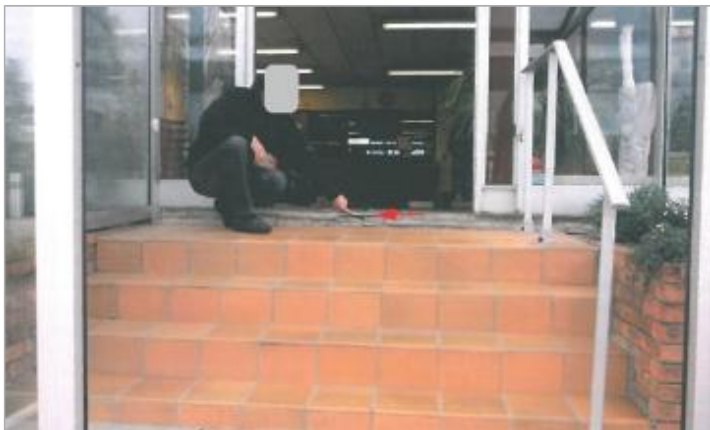
Entreprise - au bout de l'Allée du Bac