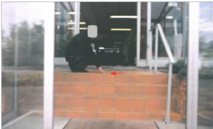
Entreprise - au bout de l'Allée du Bac