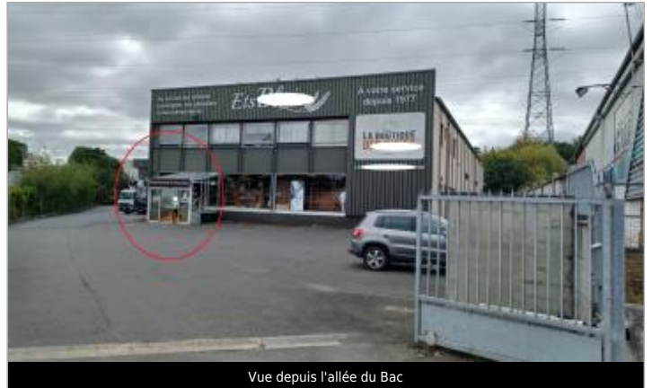
Vue depuis l'allée du Bac

Coordonnées WGS84 : X: -0.32771850 / Y: 49.17991500