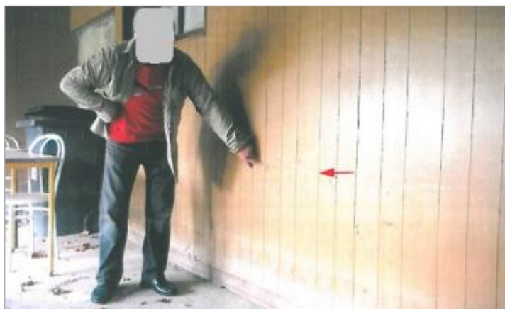
Amicale - Rue Hyppolite Monin