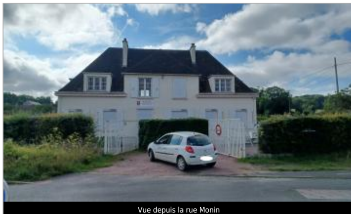
Vue depuis la rue Monin

Coordonnées WGS84 : X: -0.30922100 / Y: 49.20452300