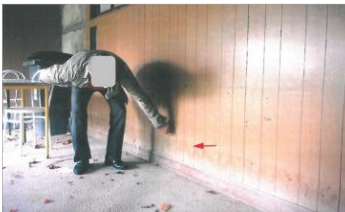
Amicale - Rue Hyppolite Monin