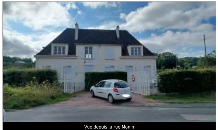
Vue depuis la rue Monin

Coordonnées WGS84 : X: -0.30922100 / Y: 49.20452300