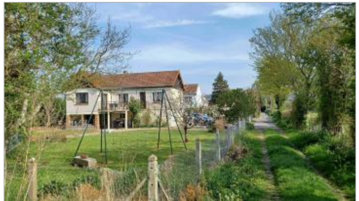
Marche de l'escalier extérieur de la maison au 3 Moulin de la Mouche

Coordonnées WGS84 : X: 0.65948239 / Y: 49.29231600