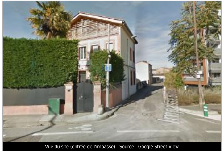
Vue du site (entrée de l'impasse) - Source : Google Street View

Coordonnées WGS84 : X: 1.42025000 / Y: 43.60265000