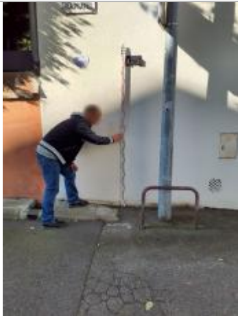
Photo du repère - mesure 1,93 m

Altitude calculée de l'eau (en m) : 135.996 m