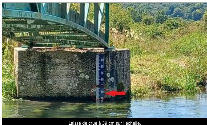
Laisse de crue à 39 cm sur l'échelle.

Maximum de l'inondation : Oui Visibilité : Oui État du repère : Disparu Pérennité : Aucune Repère calculé : Oui PHEC : Non renseigné