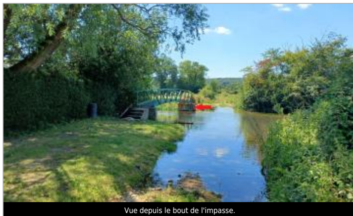
Vue depuis le bout de l'impasse.