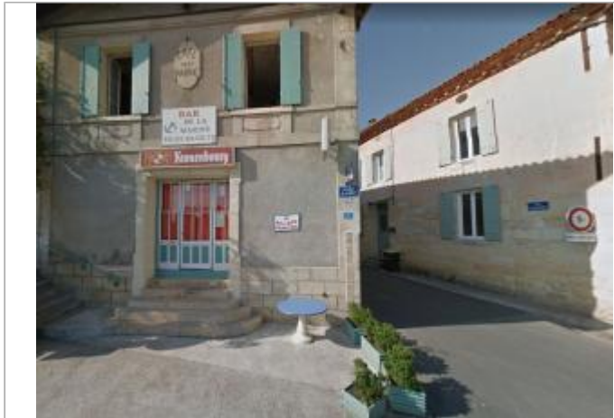
Vue du site