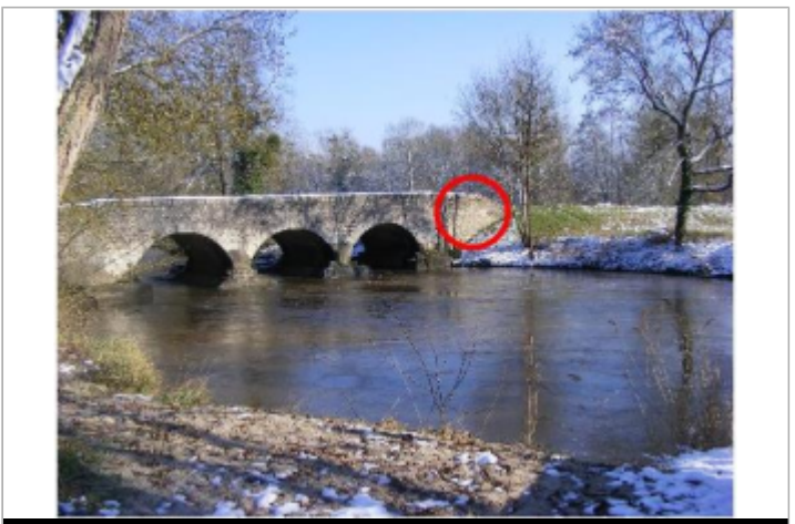
Site (source : commune de Tour-en-Sologne)

GÉOLOCALISATION Coordonnées WGS84 : X: 1.51088010 / Y: 47.54317300 Coordonnées RGF93 (Lambert 93) X: 587991.49 / Y: 6716923.06 Coordonnées RGF93 (ETRS89) : X: 1.5108801 / Y: 47.543173 Code Hydro : K4-0220 Rive de référence : Gauche