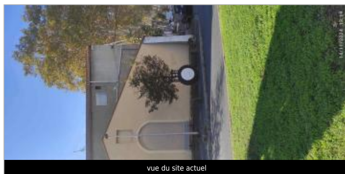
vue du site actuel

GÉOLOCALISATION Coordonnées WGS84 : X: 3.20414605 / Y: 43.33785560 Coordonnées RGF93 (Lambert 93) X: 716564.01 / Y: 6248766.69 Coordonnées RGF93 (ETRS89) : X: 3.2041461 / Y: 43.3378556 Code Hydro: Y25-0400 Rive de référence: