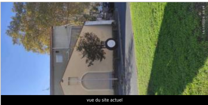
vue du site actuel

GÉOLOCALISATION Coordonnées WGS84 : X: 3.20414605 / Y: 43.33785560 Coordonnées RGF93 (Lambert 93) X: 716564.01 / Y: 6248766.69 Coordonnées RGF93 (ETRS89) : X: 3.2041461 / Y: 43.3378556 Code Hydro: Y25-0400 Rive de référence: