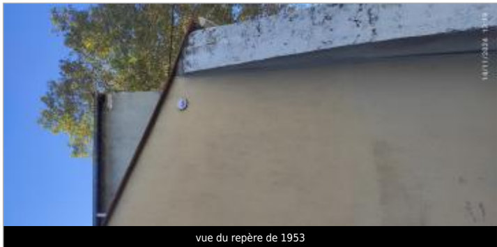
vue du repère de 1953