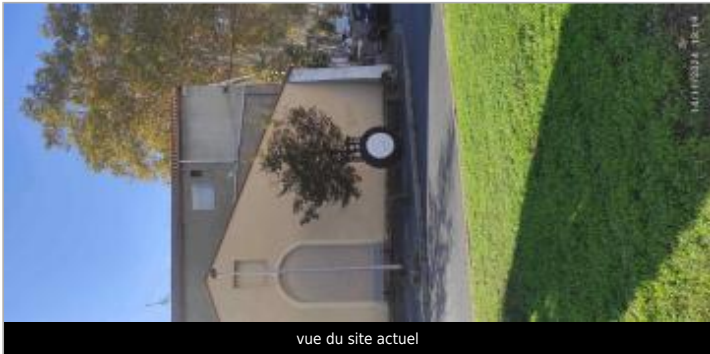
vue du site actuel