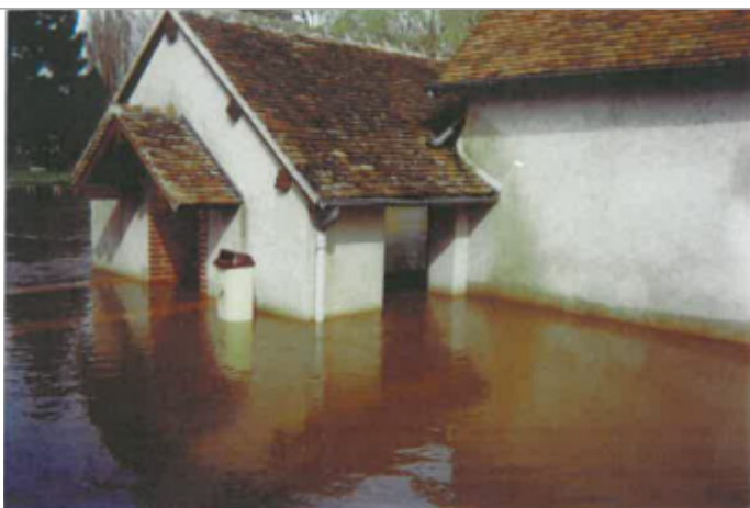
Site pendant la crue (photo recensement d'origine)

Altitude calculée de l'eau (en m) : 83.55