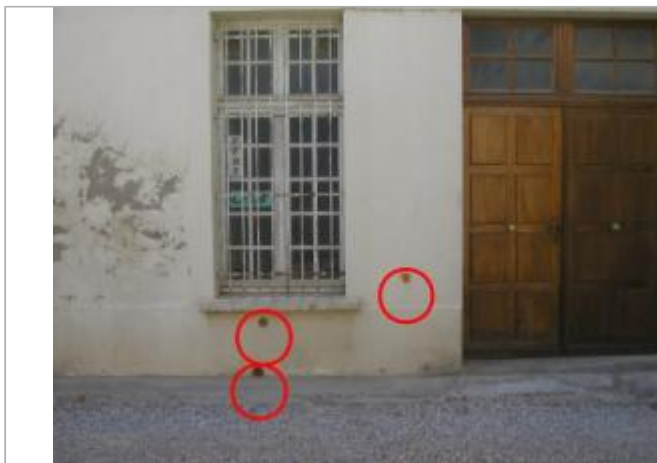
Façade bâtiment - rive droite