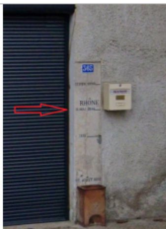
Vue du repère

Différence entre le niveau d'eau et la référence (en m) : 1.290 m