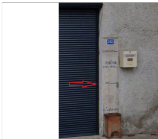
Vue du repère