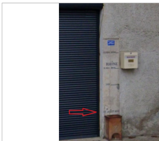
Vue du repère