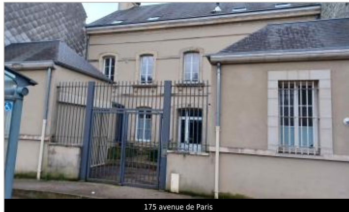
175 avenue de Paris

Coordonnées WGS84 : X: -1.61797200 / Y: 49.62898400