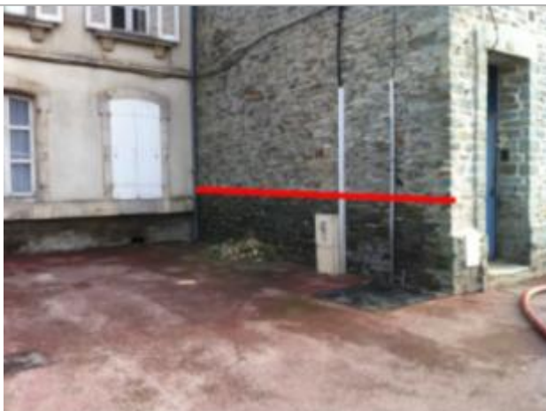
175 avenue de Paris