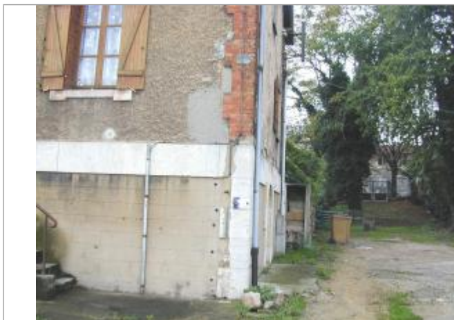
Maison éclusière au barrage de Port à l'Anglais