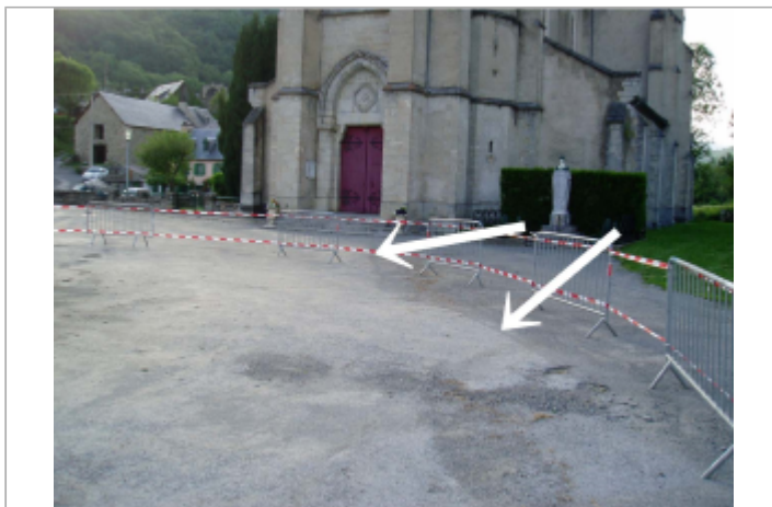
Trace de boue