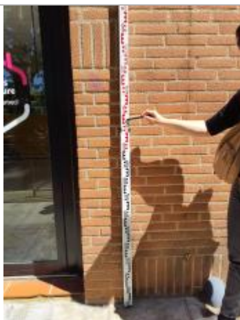
Photo du repère 29/04/2025

Altitude calculée de l'eau (en m) : 139.15 m