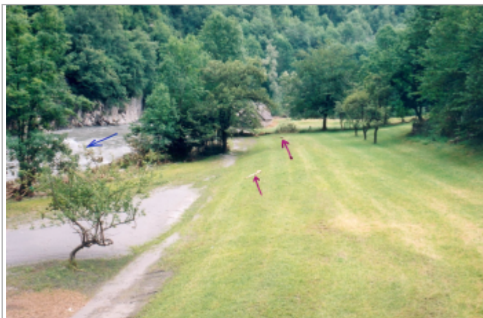
Photo du recensement d'origine.