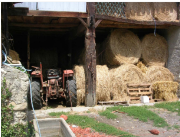
Repères des crues de 1875, 1897 et de 1977

Différence entre le niveau d'eau et la référence (en m) : 1.180 m