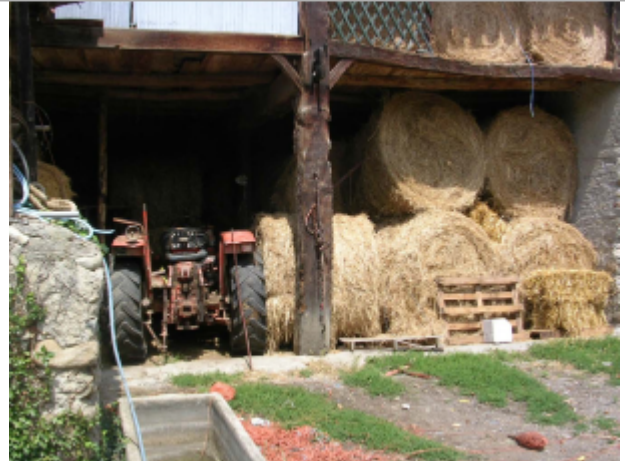
Repères des crues de 1875, 1897 et de 1977