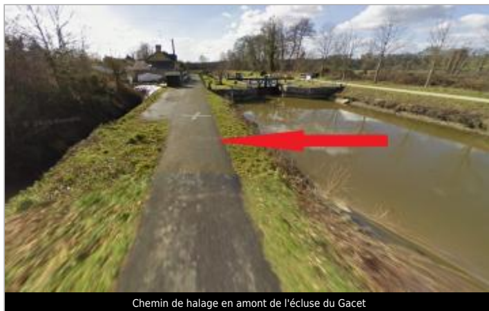
Chemin de halage en amont de l'écluse du Gacet

Coordonnées WGS84 : X: -1.66695323 / Y: 48.16636770