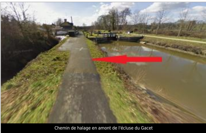
Chemin de halage en amont de l'écluse du Gacet

GÉOLOCALISATION Coordonnées WGS84 : X: -1.66695323 / Y: 48.16636770 Coordonnées RGF93 (Lambert 93) X: 353235.23 / Y: 6795362.3 Coordonnées RGF93 (ETRS89) : X: -1.6669532 / Y: 48.1663677 Code Hydro: J71-0300 Rive de référence: Gauche