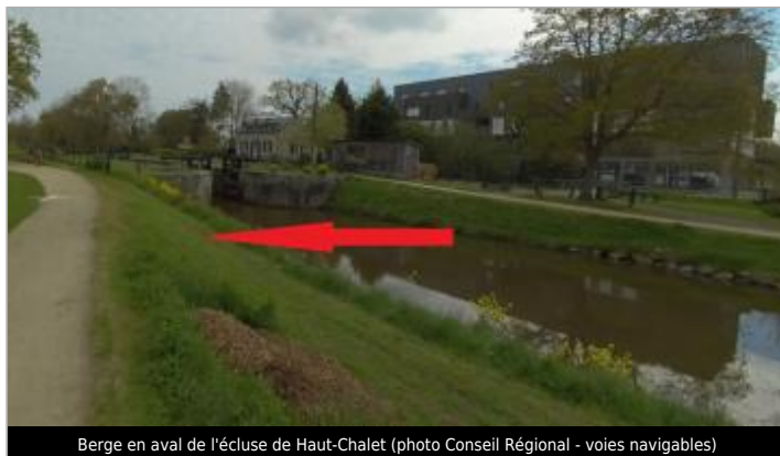
Berge en aval de l'écluse de Haut-Chalet