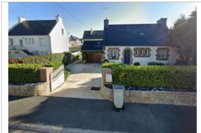
Maison au 3 impase Maurice Thorez à Ploumagoar

GÉOLOCALISATION Coordonnées WGS84 : X: -3.13513760 / Y: 48.55340220 Coordonnées RGF93 (Lambert 93) X: 247678.28 / Y: 6845711.48 Coordonnées RGF93 (ETRS89) : X: -3.1351376 / Y: 48.5534022 Code Hydro: J1--0170 Rive de référence: Droite