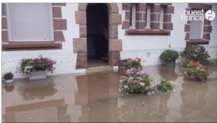
Inondation de la maison

MARQUE Maximum de l'inondation : Oui Visibilité : Non État du repère : Disparu Pérennité : Aucune Repère calculé : Non PHEC : Oui