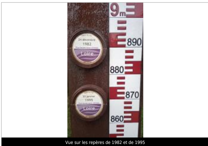
Vue sur les repères de 1982 et de 1995

Altitude calculée de l'eau (en m) : 5.64 m