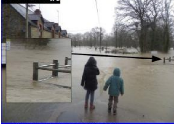
Photographie prise à 11:32 le 03/01/2014