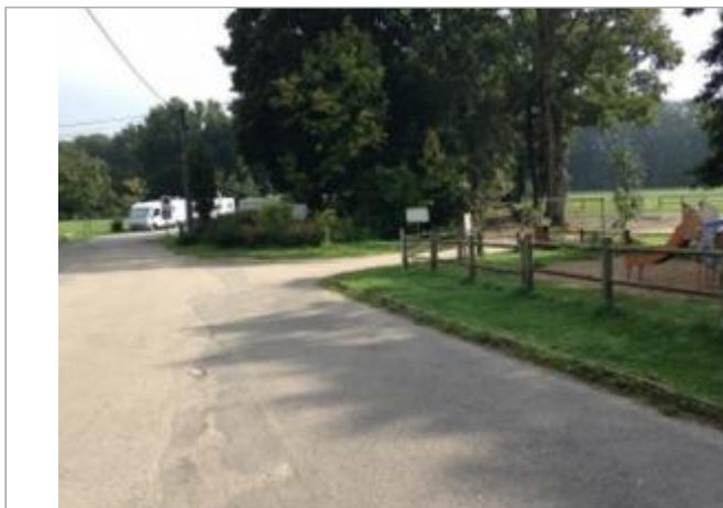
Aires de jeux, près de la maison éclusière