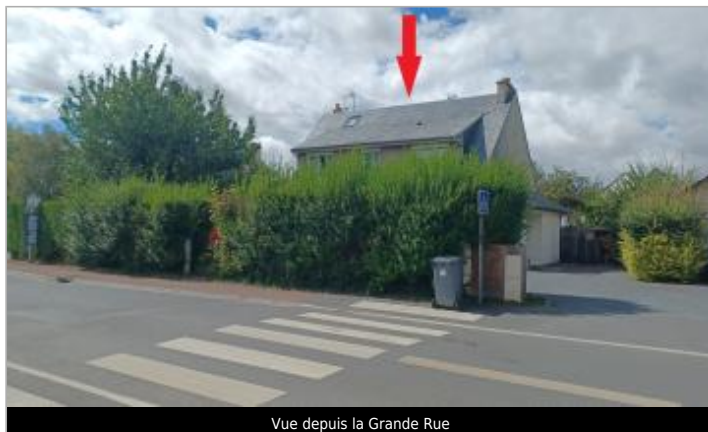
Vue depuis la Grande Rue

Coordonnées WGS84 : X: -0.38764575 / Y: 49.15864100