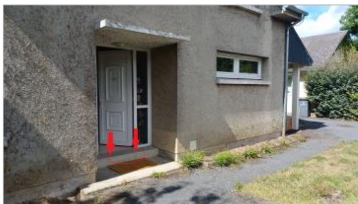
Laisse de crue au niveau du dessus de la dernière marche