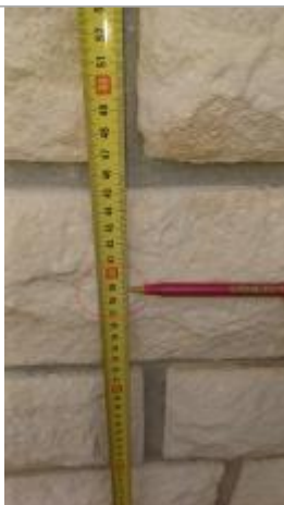
Laisse de crue à 46 cm/ haut de la dernière marche.

Altitude calculée de l'eau (en m) : 7.21