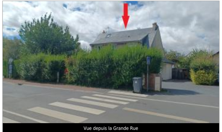
Vue depuis la Grande Rue

Coordonnées WGS84 : X: -0.38764575 / Y: 49.15864100