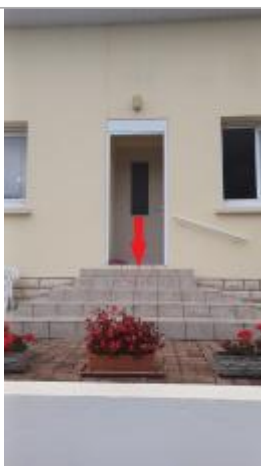
Laisse de crue à 11 cm/sol de la marche.