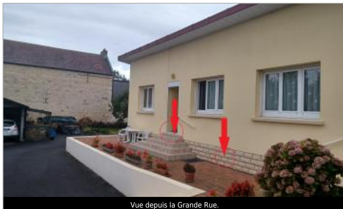
Vue depuis la Grande Rue.

Coordonnées WGS84 : X: -0.38999454 / Y: 49.15558370