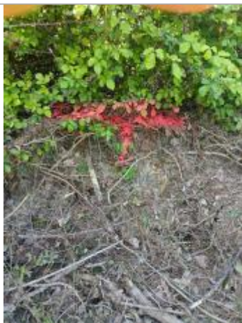
Vue de la laisse - auteur : AGERIN