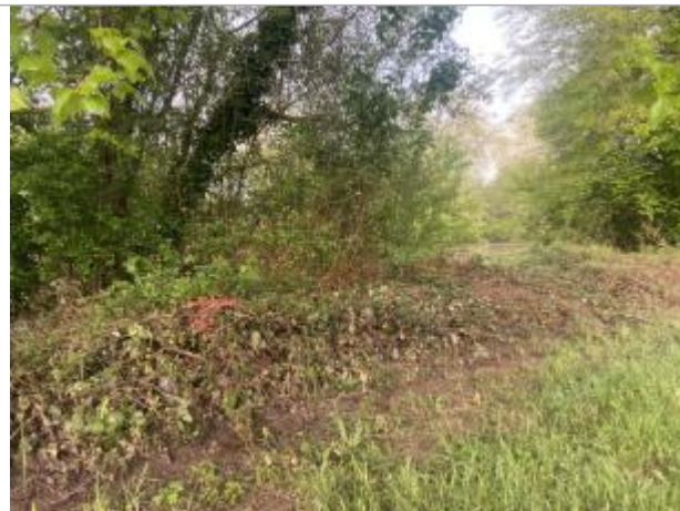
Vue du site - auteur : AGERIN

Coordonnées WGS84 : X: 1.39249140 / Y: 45.13241760