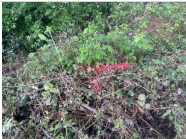
Vue de la laisse - auteur : AGERIN