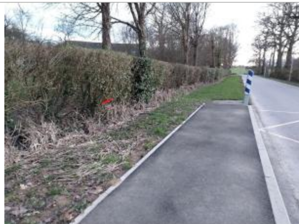
Bord de la RC 5 à la grande Feuillée

Coordonnées WGS84 : X: -1.78741377 / Y: 48.01624530