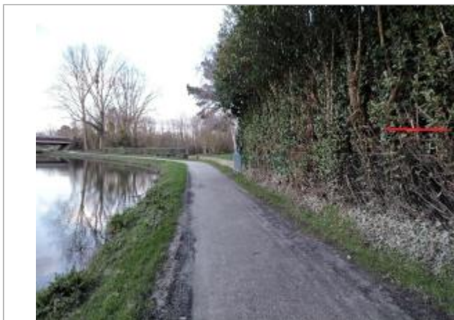
Chemin de halage en aval de la RD177

Coordonnées WGS84 : X: -1.77312867 / Y: 48.02423540