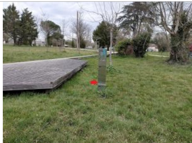
Totems de repères de crues dans les prairies Saint-Martin

Coordonnées WGS84 : X: -1.67371920 / Y: 48.12406110