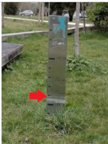
Totems des repères de crues

Altitude calculée de l'eau (en m) : 26.6