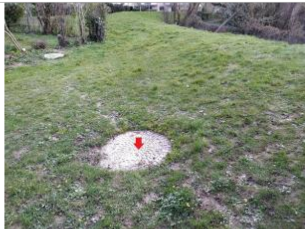
Dessus de la plaque réseau d'assainissement

Coordonnées WGS84 : X: -1.67257189 / Y: 48.12686490