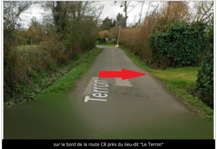
sur le bord de la route C8 près du lieu-dit "Le Terron"

Coordonnées WGS84 : X: -1.65452871 / Y: 48.06550650