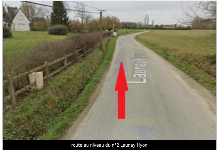
route au niveau du n°2 Launay Hyon

Coordonnées WGS84 : X: -1.66186104 / Y: 48.06770760