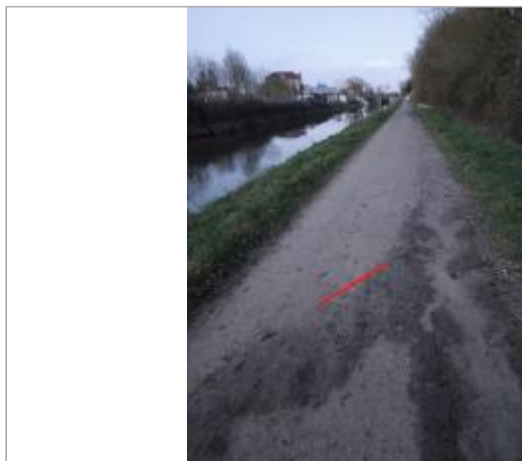
Relevé de l'inondation sur le chemin de halage

Coordonnées WGS84 : X: -1.74939093 / Y: 48.09252400