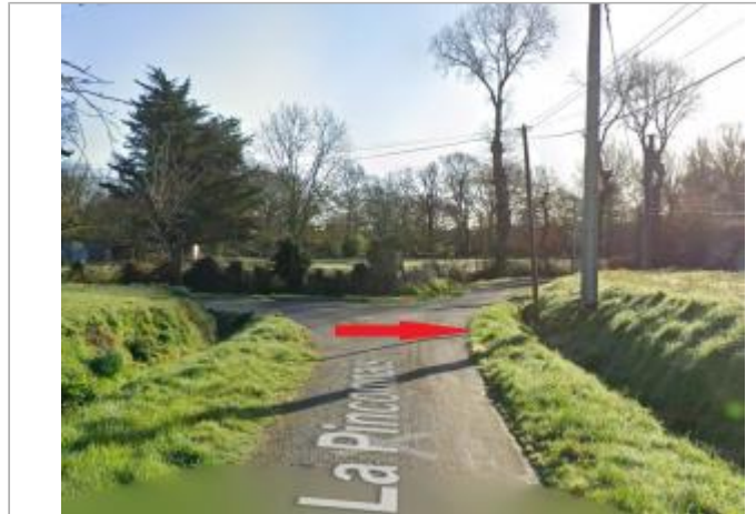
carrefour au lieu-dit la Pinconnais

Coordonnées WGS84 : X: -1.67239366 / Y: 48.04836030