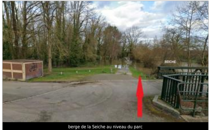
berge de la Seiche au niveau du parc

Coordonnées WGS84 : X: -1.66622247 / Y: 48.03817160