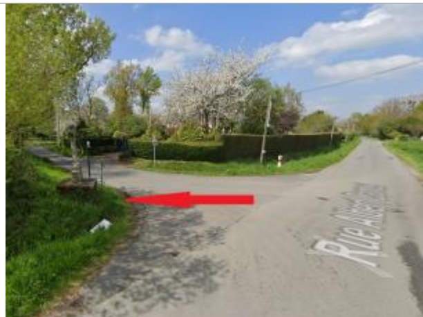
calvaire à l'intersections des rues Albert Camus et le Patis Malais

Coordonnées WGS84 : X: -1.66911355 / Y: 48.03414350