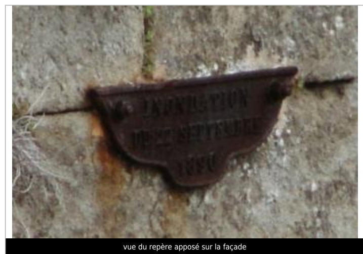
vue du repère apposé sur la façade