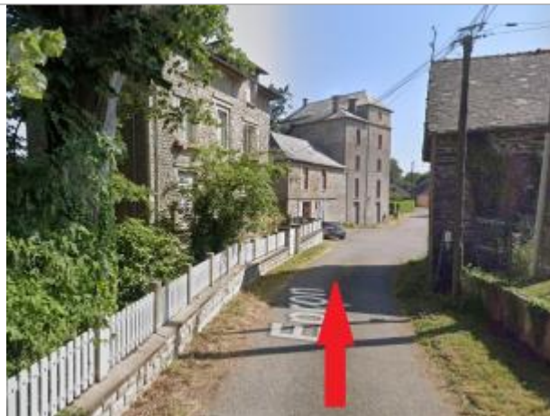
route devant le moulin de l'Epron

Coordonnées WGS84 : X: -1.53847839 / Y: 48.01559610