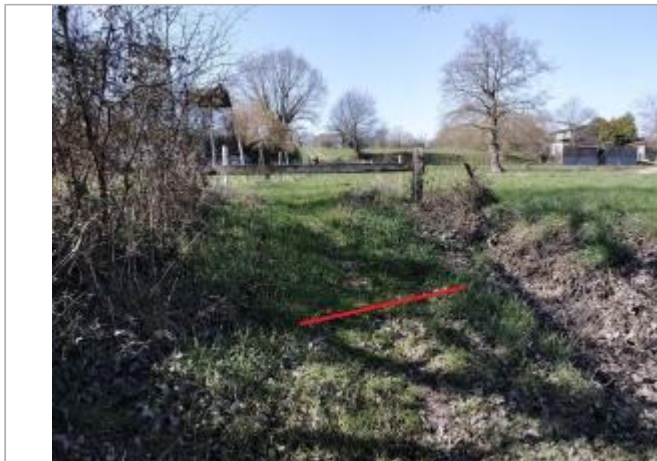
Limite inondée chemin au lieu-dit Le vault Martin

Coordonnées WGS84 : X: -1.57048919 / Y: 48.12997710