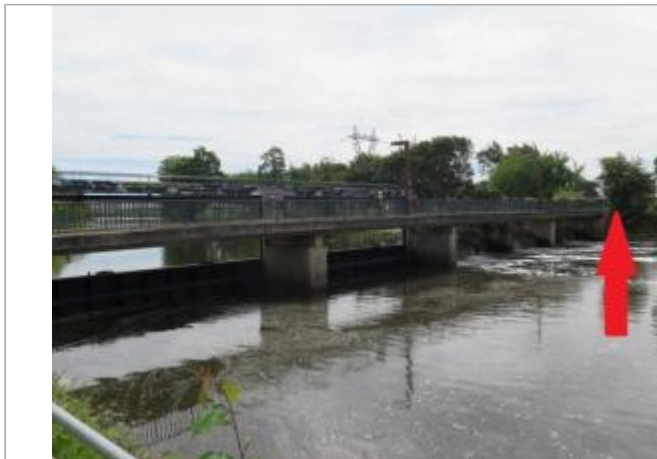
Berge de la Vilaine au niveau du vannage du Comte

Coordonnées WGS84 : X: -1.70847746 / Y: 48.10685920